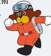
福岡市消防局 マスコットキャラクター 「ファイ太くん」