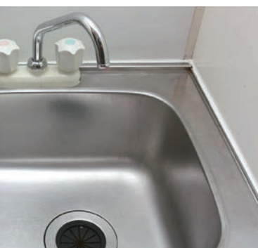
◆ 普段からのこまめなお掃除も忘れずに! ◆