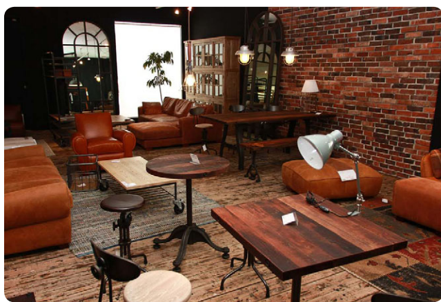
デザイン性が高く、家具の種類も豊富な関家具ショールーム。

九州はもちろん全国的に家具の一大産地として知られる大川。その大川家具の老舗のひとつ「関家具」さんから家具へのこだわりや選び方、おすすめの商品等をお聞きしました。