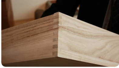
互い違いに板を組み合わせる「組手」は接合強度が高い。