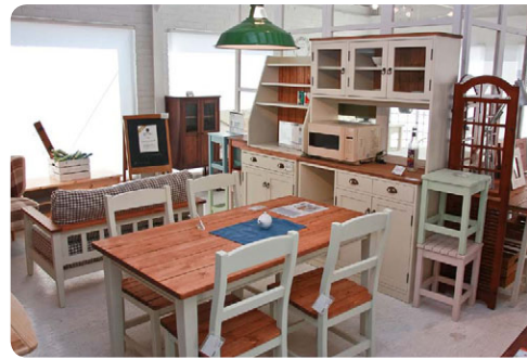
女性スタッフによって開発されたブランド「mam(ママ)」シリーズ。