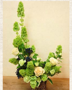
モルセラのクレッセント