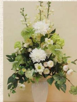
枝を使った爽やかなアレンジメント