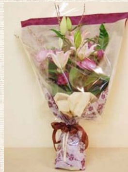
歓送迎会などでも活躍する「桜の花束」