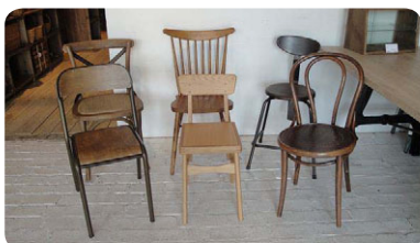
椅子といってもたくさんのデザインがあり、選ぶのに悩みそう。