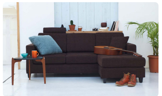
ファブリック(張地)にもこだわったNew Michel IV(ニューミッシェル IV)は全30色から選択が可能。