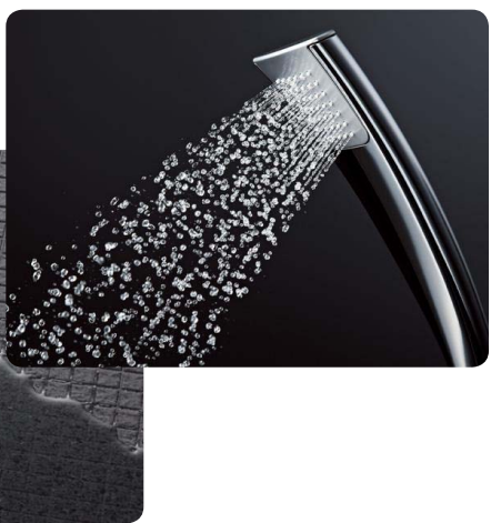
節水効果のある「エアインシャワー」や安心・安全な「ほっカラリ床」など、より快適＆便利に進化しています！