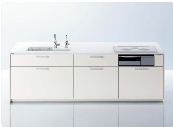
家事導線を考えたシステムキッチンを使い勝手も抜群です！

■ っぱり日々の「コツ」が長持ちの秘訣になります。 ■ 「ちなみに、TOTOさんのキッチンのPRポイントはどこですか？」