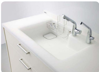
キッチン周りには特にこだわり、シンクや水栓などにも工夫を凝らしています。

■ 水まわりのメーカーですので、水の流れにことん拘っています。ほうきのように幅広に広がり素早く洗える「水ほつき水栓」、排水口の位置をシンクの隅に寄せ、すべり台をすべるように水を排水口へ一直線に押し流す傾斜をつけた「すべり台シンク」、足で操作して吐水・止水できる「つま先らく押し水栓スイッチ」などがあります。また弊社ではユニバーサルデザインの研究に早くから取り組んでおり、疲れにくい、負担がかかりにくい「人間工学的研究」に裏付けられたキッチンを開発していますので、リフォームをお考えの際には是非候補に入れていただきたいと思います。