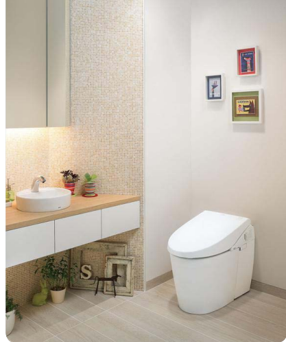
「ネオレスト」は使うたびに除菌しており、汚れにくく、お掃除しやすくなっています。

最新のウォシュレット「一体便器」「ネオレスト」やウォシュレットの「アプリコット」は水道水から「きれい除菌水」を作り出し、汚れの元凶となる見えない細菌まで除菌する機能がついていますので、今までと比べて汚れにくく、掃除もラクになります。また、超節水3.8L洗浄や瞬間暖房便座機能が