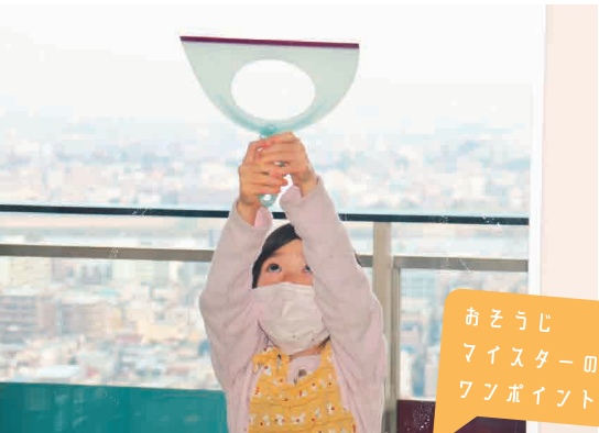
おそうじマイスターのワンポイント

家族で役割を決めたら、一緒に掃除をしなくても、それぞれの都合に合わせて進めることもできます。