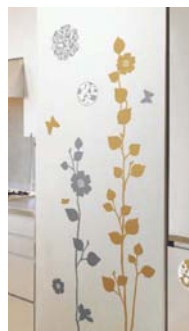
壁紙の上から貼って、デコレーションを楽しむグラフィックステッカー。種類がたくさんあって、選ぶのも楽しい。