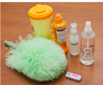
壁紙のお手入れに役立つハタキや中性洗剤、消しゴム。水や洗剤溶液はスプレーしやすいように容器に入れておくと便利。