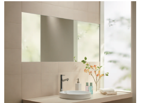
デザインもオシャレな調湿建材「エコカット」は、結露を大幅に軽減してくれます。

熱伝導率の低い樹脂製サッシは外気温度に左右されず、「断熱効果」「結露軽減効果」を發揮。