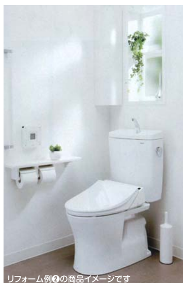
リフォーム例②の商品イメージです

希望小売価格203,280円～が、 特別価格 工事費・消費税込で、 130,000円～